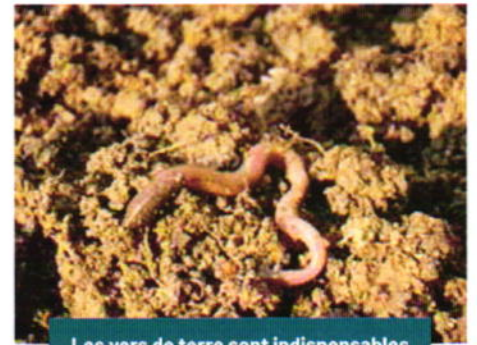
Les vers de terre sont indispensables pour aérer le sol

La préservation d'une continuité écologique dans le sol paraît essentielle. C'est pourquoi le concept de « trame brune » est apparu, sur le modèle des trames vertes et bleues mais appliqué à la continuité des sols. En ville, il est donc aujourd'hui crucial de réfléchir au maintien d'espaces de pleine terre aussi continus que possible.